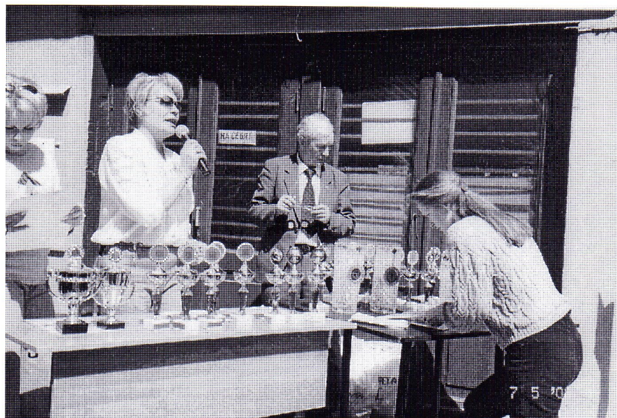
Вручение призов за победы в отдельных видах спартакиады-2003