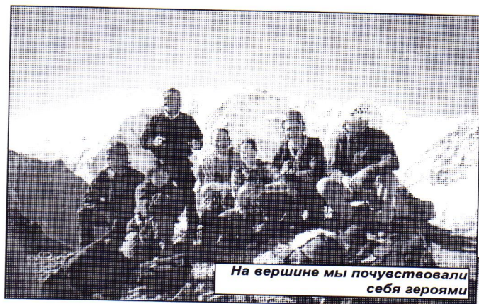
На вершине мы почувствовали себя героями