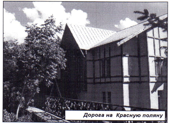
Дорога на Красную поляну

Точку в экстремальных экскурсиях мы решили поставить поездкой в Красную Поляну, дорога в которую ведет по крутому, горному серпантину, и градус поворотов достигает 270. При закате солнца горная долина освещается таким образом, что находящиеся в ней коричневые папоротники становятся красными, а так как их там очень много, то вся долина становится красной, отсюда она и получила свое название - Красная Поляна. Воздух там необыкновенно чистый и све-