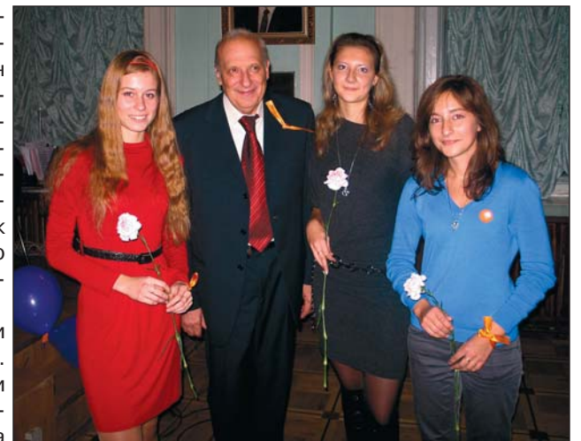
Неизгладимые впечатления оставил факультетский вечер на присутствующих - студентов всех курсов и гостей:

3 октября у всех органиков нашего замечательного университета был настоящий праздник. Много людей было задействовано в организации, и все выложились на полную катушку, не жалея сил ради родного факультета. Все вокруг дышало радостью, сам воздух пропитался особой теплотой. Концерт захватил с самого начала, и ведущим удалось удержать публику в этом настроении до конца.