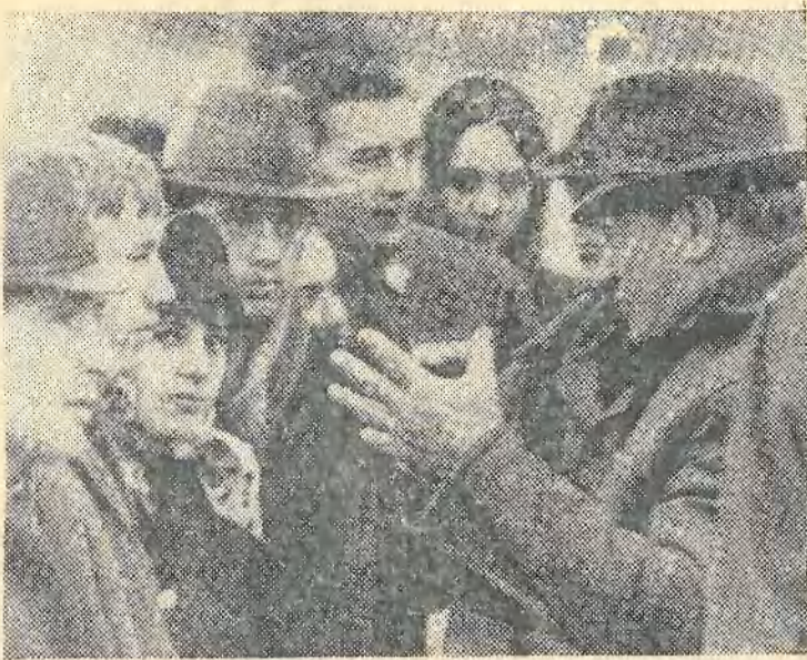
ПО МЕСТАМ БОЕВОЙ СЛАВЫ ПОДМОСКОВЬЯ.

факультете очень... положение созда-... Т-13, студенты... оек по математи-... по строению ве-... коллоквиума по... ачалась паника в... от выясняем, по-