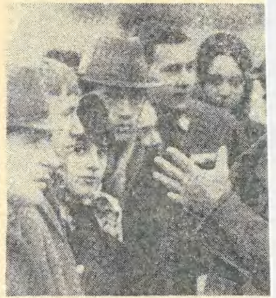
ПО МЕСТАМ БОЕВОЙ СЛАВЫ