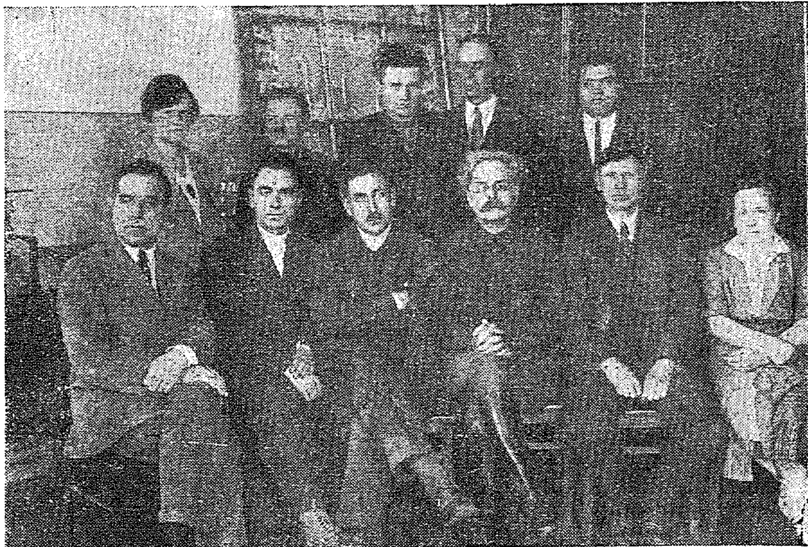
Кафедра органической химии.

Сдано в печать научных 5 работ. печатано дополнительных пособий к курсам органической химии 20 страниц подготовлено к печати 50 страниц — автор проф. МАКАРОВ-ЗЕМЛЯНСКИЙ; дано 3 рецензии на учебники органической химии. Организованы 2 выс-