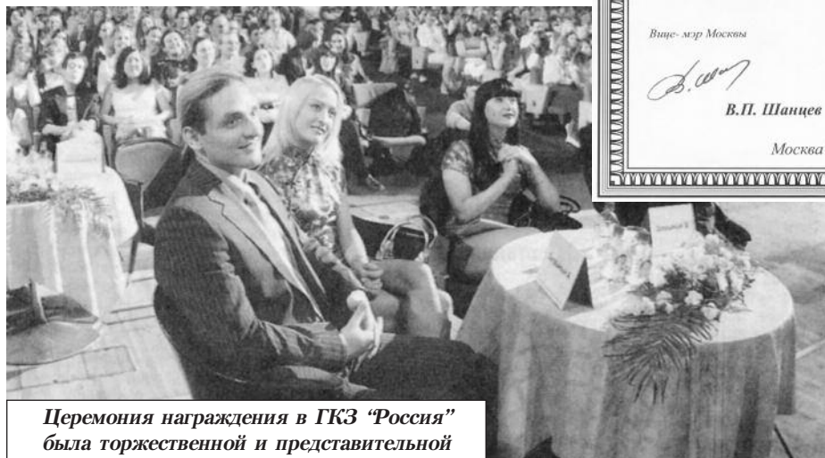
Церемония награждения в ГКЗ “Россия” была торжественной и представительной