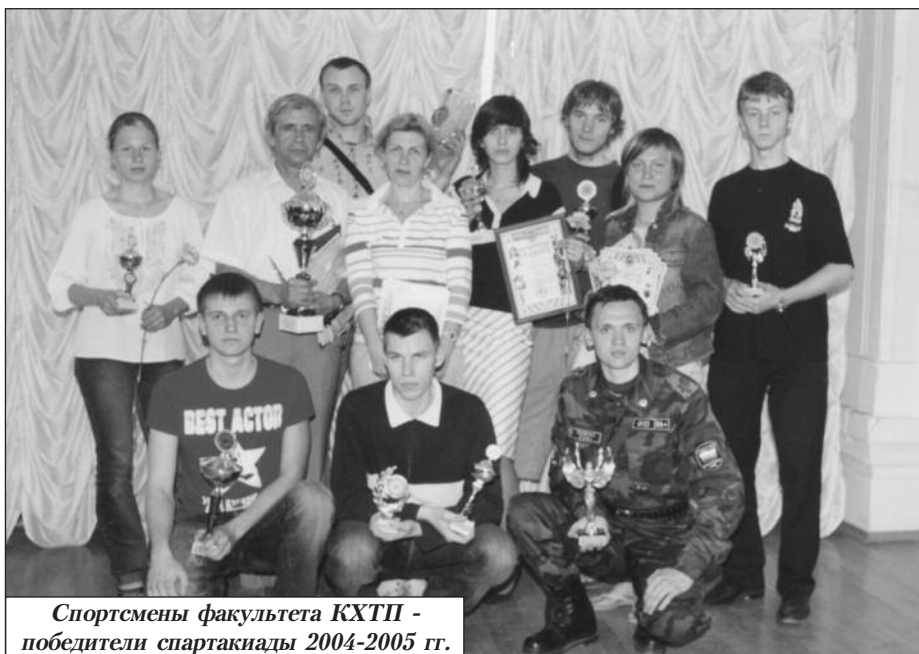
Спортсмены факультета КХТП - победители спартакиады 2004-2005 гг.