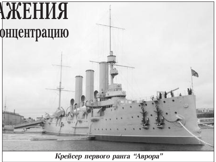
Крейсер первого ранга "Аврора"