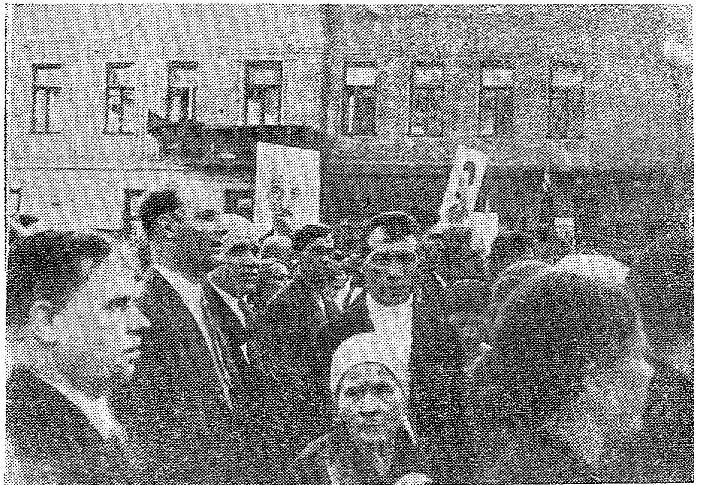
Менделеевцы на митинге.

Да здравствует непобедимый сталинский блок коммунистов и беспартийных!