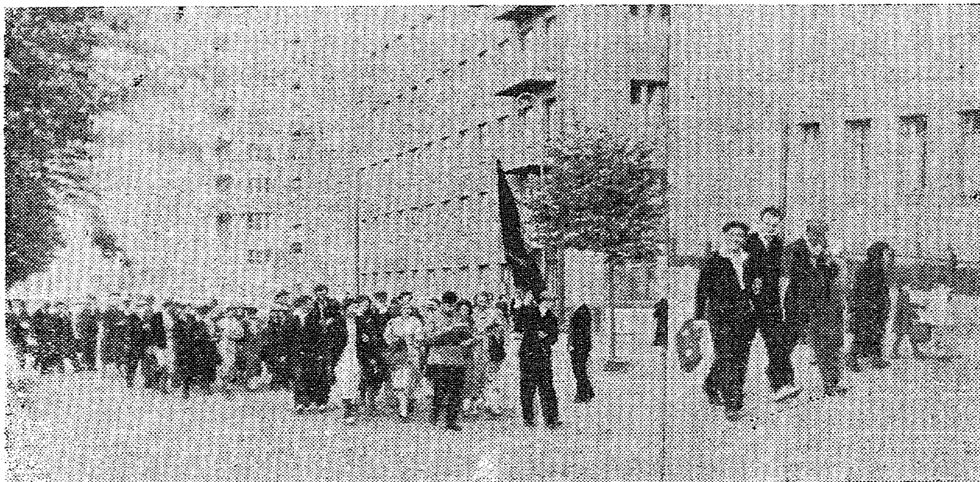
Колонна МХТИ отправляется на митинг.